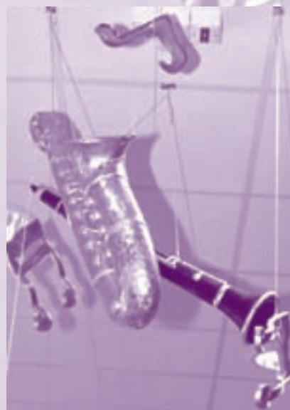
VERSIERING ROND HET THEMA MUZIEK IN HET ZONNEHUIS AMSTELVEEN

Voor psychogeriatrische patiënten wordt de belevingsgerichte zorg steeds belangrijker. Daarnaast ook het levensboek: 'ik herinner me'. Samen met verzorgers teruggaan naar belangrijke levensmomenten'. Boekholdt deed een oproep aan de bezoekers om meer van elkaar te leren en ervaringen uit te wisselen. Het Amsterdams Swing Trio zorgde voor een feestelijke afsluiting van een gedenkwaardige en uitstekend georganiseerde cliëntenradendag.